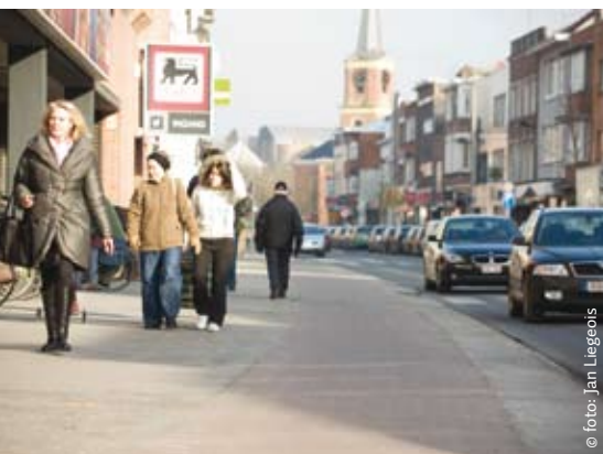
De ruimte die ter beschikking komt door het verwijderen van een langspaarkeerstrook, is integraal benut voor nieuwe fietspaden en brede voetpaden.