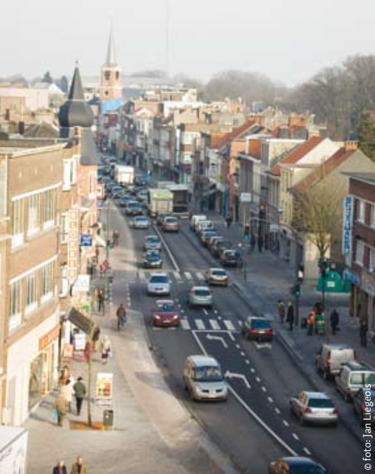
Brede, stoere trottoirbanden begeleiden de rijweg